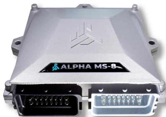
Электронный блок управления.