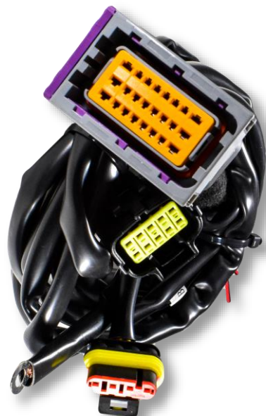
Основные жгуты электропроводки