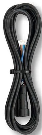
Кабель связи с кнопкой управления