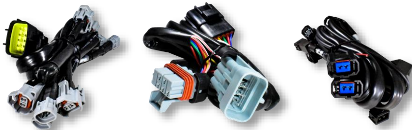
Жгуты отключения бензофорсунок AM-HR (10 разных типов).