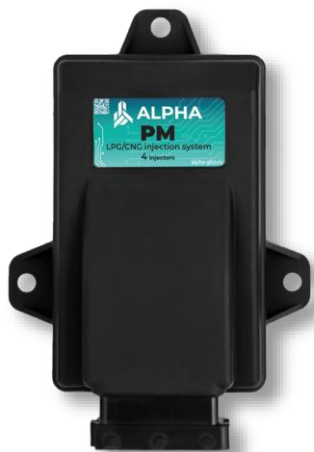
Электронный блок управления.