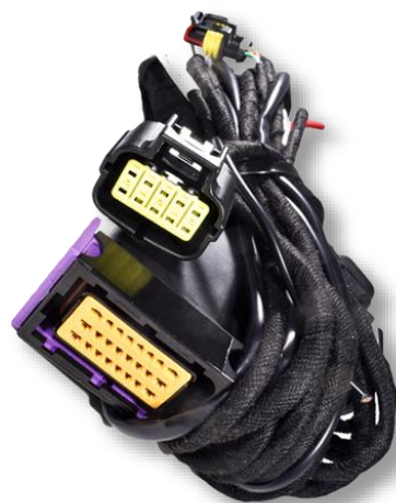
Основной жгут электропроводки