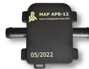
Датчик давления/разрежения и температуры газа APS-12