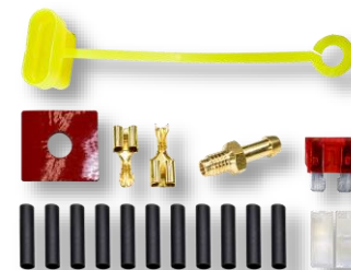
Монтажный комплект (зависит от модификации комплекта)..