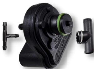
Датчик давления/разрежения и температуры газа APS-14 2к2.