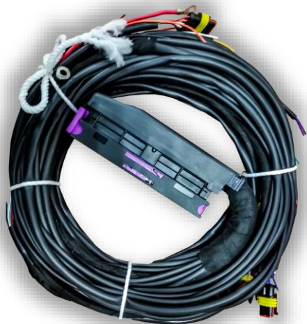
Основной жгут электропроводки.