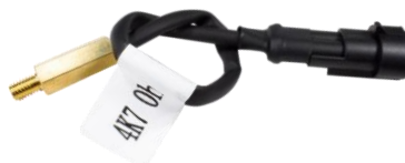
Датчик температуры редуктора (зависит от модификации комплекта).