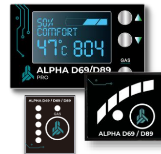
Переключатель вида топлива с индикатором режимов работы и уровня топлива (зависит от модификации комплекта).