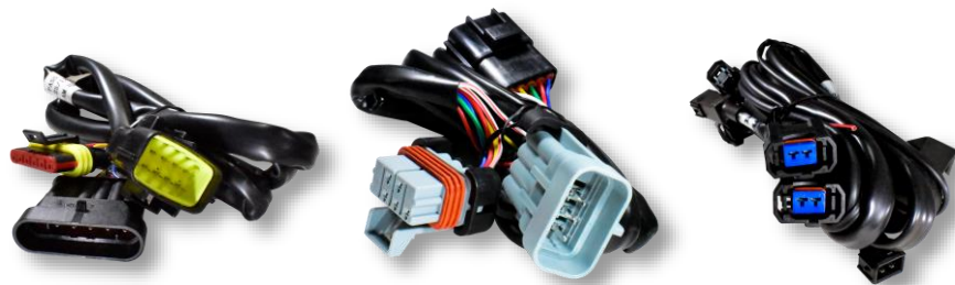
Жгуты отключения бензофорсунок AM-HR (10 разных типов).